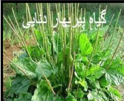
گیاه پیر بهار دناایی