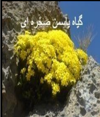
گیاه یاسمن صخره ای