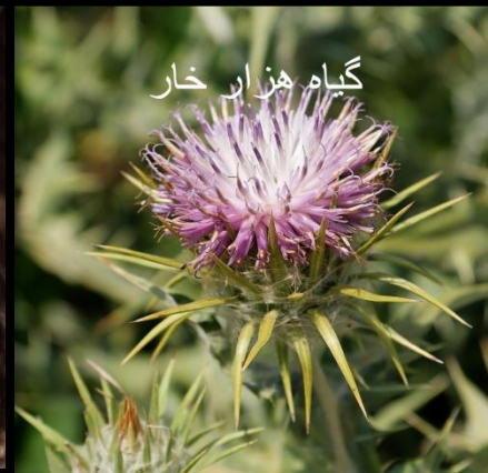
گیاه هزار خار