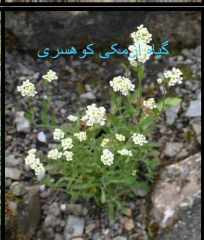
گیاه از مکی کوهسری