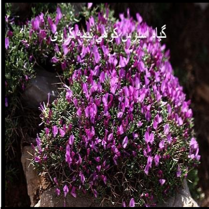
گیا اسپرس کوهی بنفشه کزوی