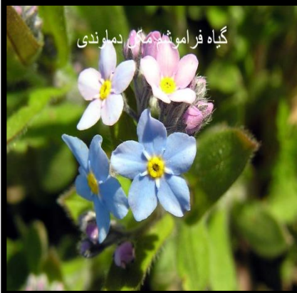
گیاه فراموشدمان دماوندی