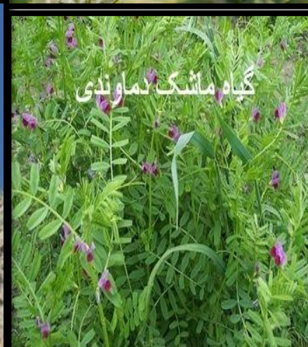
گیاه ماشنگ دماوندی