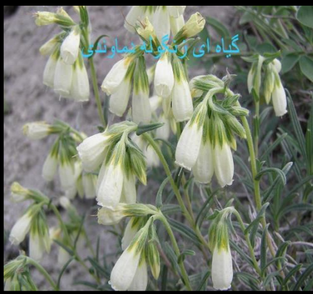
گیاه ای رنگوله دماوندی