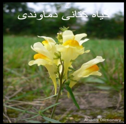
گیاه کتانی دماوندی